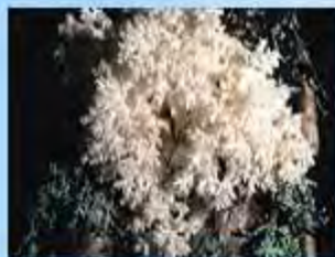
Ежевик коралловидный или гериций