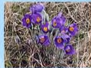
Прострел раскрытый, или сон-трава