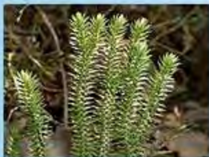
Баранец обыкновенный, или Плаун баранец