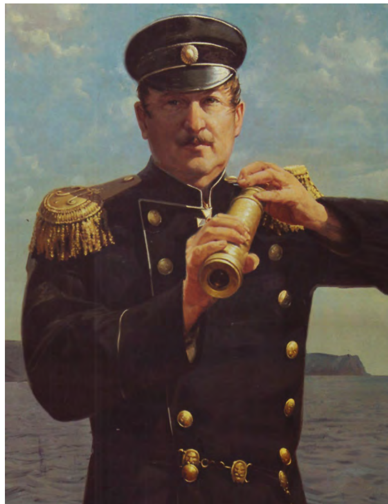
Павел Степанович Нахимов (1802–1855)